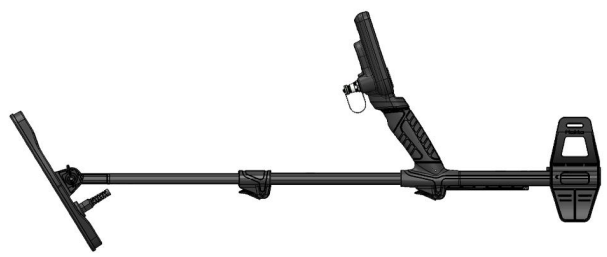
1.4 Metal dedektörü