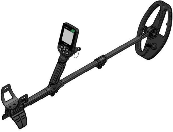
1.1 Metal dedektörü