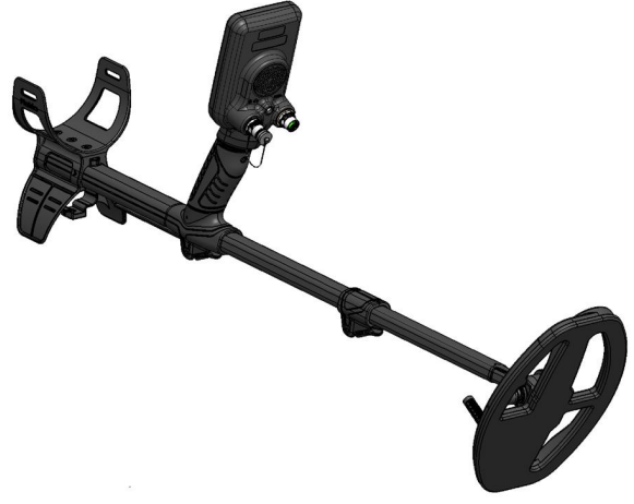
1.2 Metal dedektörü