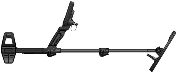
1.3 Metal dedektörü