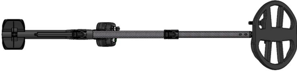
1.7 Metal dedektörü