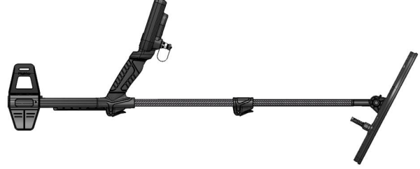
1.2 Metal dedektörü