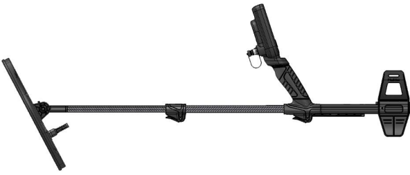
1.3 Metal dedektörü