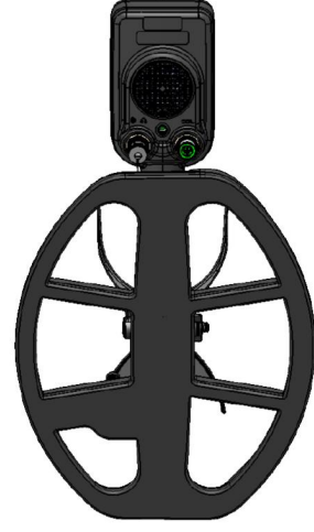
1.6 Metal dedektörü