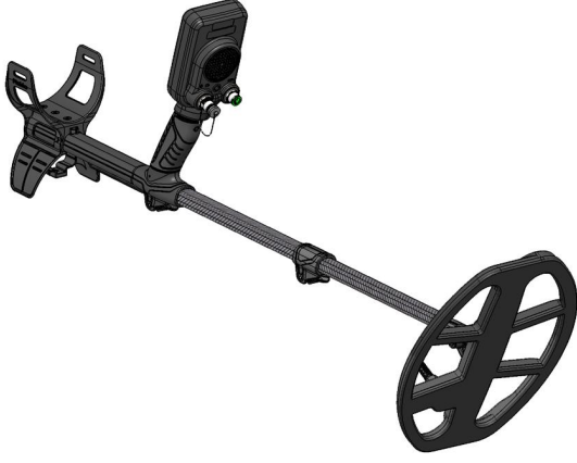
1.1 Metal dedektörü