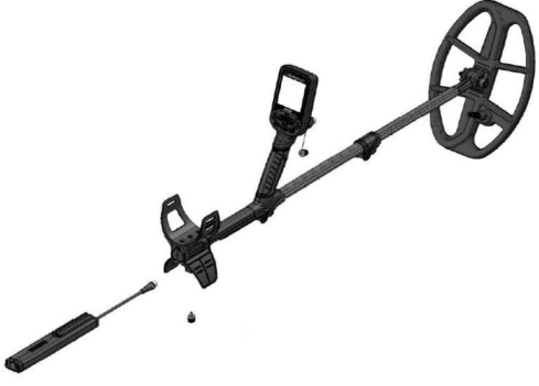
2.2 Metal dedektörü