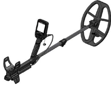
2.1 Metal dedektörü