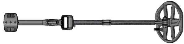
1.4 Metal dedektörü